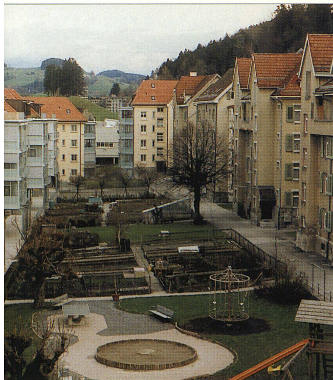
Der Innenhof der Siedlung Hagenbuch: Der halbprivate, jedoch öffentlich zugängliche Freiraum ist ein Musterbeispiel für siedlungsbezogene Raumöffentlichkeit.