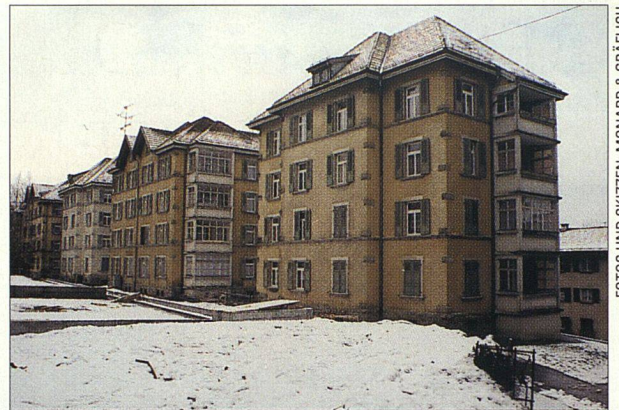
Bestand vor der Sanierung (Januar 1989).