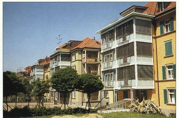
Nach Abschluss der Sanierung der Nordzeile (1993).