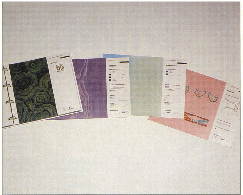
Die 4teilige Dokumentation mit über 160 Mustertafeln stellt für Architekten, Immobilienverwalter und Malermeister ein praktisches Präsentations- und Verständigungsmittel dar.

IMMER MEHR FACHLEUTE STELLEN SICH IN IHREM BERUFLICHEN ALLTAG DEN WACHSENDEN ANFORDERUN- GEN RUND UM DAS PHÄNO- MEN FARBE. PRO COLORE – EINE DACHORGANISATION FÜR ALLE, DIE FARBE ALS ECHTE HERAUSFORDERUNG EMPFINDEN – BIETET HIER UNTERSTÜTZUNG.