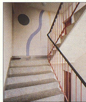
Freundliches Treppenhaus durch Farbakzente.

CreativColor, die gemeinsame Dienstleistungsorganisation des Schweizerischen Maler- und Gipsermeister-Verbandes SMGV und der Schweizerischen Zentralstelle für Baurationalisierung CRB, hat eine einzigartige Dokumentation zu verschiedenen dekorativen Maltechniken erarbeitet. Damit wurde eine übersichtliche Grundlage für individuelles und differenziertes Gestalten geschaffen, die gleichzeitig – dank der reichhaltigen Illustration mit Musterabbildungen – die Verständigung zwischen allen Beteiligten vereinfacht.