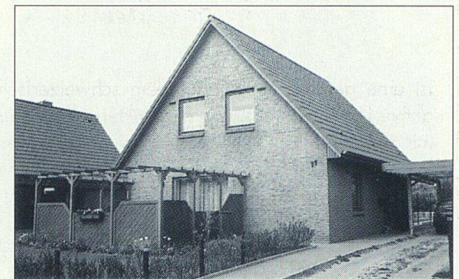
Ein selbst gebautes Eigenheim für wenig bemittelte Haushalte in Lübeck.

Der Lübecker gemeinnützige Bauverein, eine Genossenschaft mit etwa 4500 Wohnungen, die von Johannes Thomsen geleitet wird, stellte am deutschen Genossenschaftskongress gleich drei besondere Bauwerkstypen vor: Umbau einer Kasernenanlage in 750 Wohnungen, Neubausiedlung mit vier von je einem Architektur-Team geplanten, speziell kostengünstigen Überbauungen sowie Einfamilienhäuser, die von den nachmaligen Käufern teilweise selbst aufgemauert und ausgestattet wurden. Wie manche andere in Deutschland, verwaltet auch die Lübecker Baugenossenschaft zusätzlich zum eigenen Bestand Wohnliegenschaften im städtischen Eigentum.