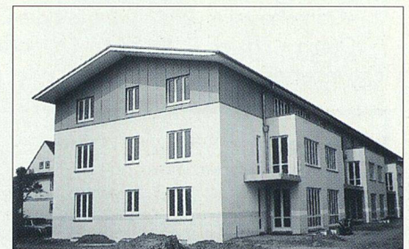
Die Schönheit des Einfachen illustriert diese Häuserzeile einer fast beendeten, genossenschaftlichen Wohnsiedlung des «Bauverein» in Lübeck.