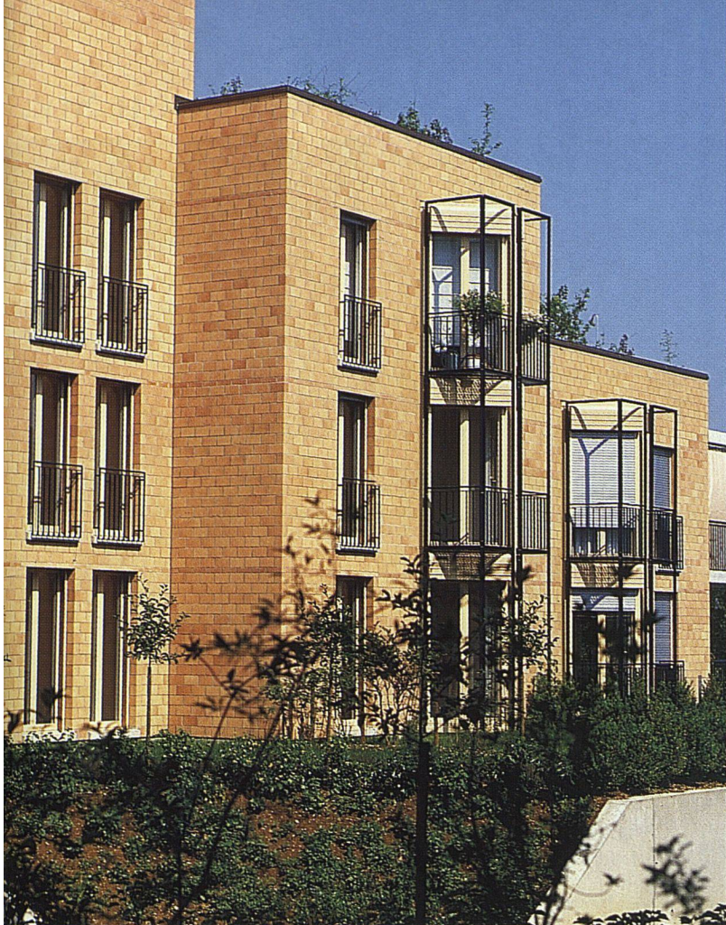
Backstein ist neben Holz der wichtigste biologische Baustoff. Seine natürliche Beschaffenheit vermittelt Behaglichkeit und hohe Wohnqualität. Im Bild: Siedlung Kreuzmatt, Arlesheim.

richtigen Mengenverhältnis miteinander vermischt, wobei der Basismasse für Ziegel zusätzlich feiner Quarzsand als Magerungskomponente beigegeben wird. Nach einer mechanischen Zerkleinerung werden die Grundstoffe unter Wasser- und Dampfzugabe zu einer plastischen Masse aufbereitet. Um die Porosität bei Backsteinen zu verbessern, kann die Backsteinmasse auch mit Sägemehl angereichert werden, das während des Brennprozesses restlos verbrennt. Die dadurch entstehenden Poren verbessern die Isolations- und Saugfähigkeit.