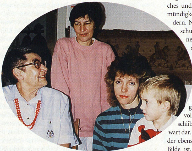
Text und Foto: Bruno Burri

▷ Am Anfang stand eine Idee: «Wir Jungen müssen doch in unserer Siedlung etwas Hilfreiches, etwas Nützliches für die Alten tun.» Mit dieser edlen Absicht nahm eine Arbeitsgruppe, im Einverständnis mit dem Vorstand der Baugenossenschaft «Freiblick» in Zürich, die Arbeit auf, den Alten im Quartier zu helfen.