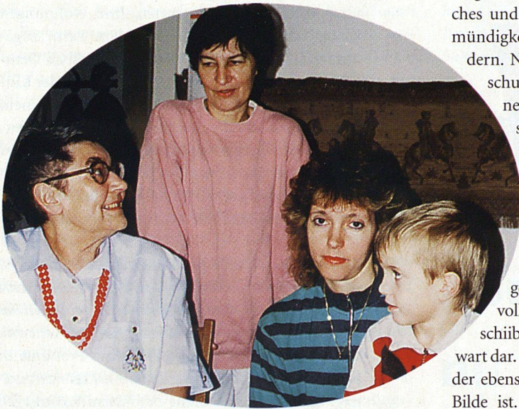
Text und Foto: Bruno Burri

▷ Am Anfang stand eine Idee: «Wir Jungen müssen doch in unserer Siedlung etwas Hilfreiches, etwas Nützliches für die Alten tun.» Mit dieser edlen Absicht nahm eine Arbeitsgruppe, im Einverständnis mit dem Vorstand der Baugenossenschaft «Freiblick» in Zürich, die Arbeit auf, den Alten im Quartier zu helfen.