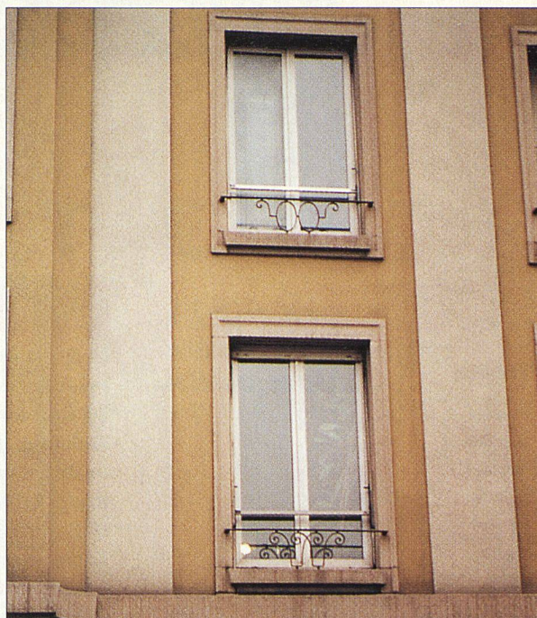
WGN-Liegenschaft Margarethenstr. 60 im typischen Basler Baumgartner-Stil.