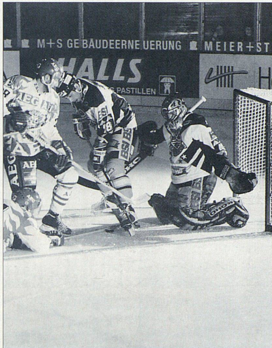
Beachten Sie den Teilnahmetalton auf der vierten Umschlagseite.

wie notwendig es für die nachwachsende Generation ist, Perspektiven zu haben. Und so macht sich Meier + Steinauer AG auch in vielen Bereichen ausserhalb der Unternehmensleistungen stark für junge Leute. Im Sport-Sponsoring und in der Unterstützung von Freizeitaktivitäten beispielsweise. Oder mit interessanten Ausstellungen zu Themen, die auch junge Leute