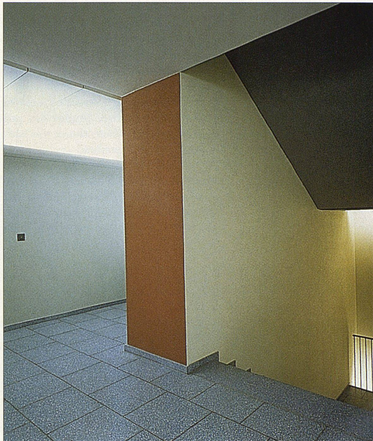
Geschäftshaus Eggbühl in Zürich: Beispiel für eine gelungene Farbgebung der Erschliessungsräume.

MIT EINER GEEIGNETEN FARBGEBUNG VON ERSCHLIESSUNGSRÄUMEN UND EINGANGSBEREICHEN KÖNNEN DIE ARCHITEKTONISCHE GESTALTUNG UND DER KOMMUNIKATIVE CHARAKTER EINES GEBÄUDES EFFEKTIVOLL UNTERSTRICHEN WERDEN. FÜR DIE BEWOHNER/INNEN EINES WOHNHAUSES BEDEUTET EIN GELUNGENES FARBKONZEPT AUSSERDEM EINE ORIENTIERUNGSHILFE UND WOHLBEFINDEN IM RAUM. WAS HIER AM BEISPIEL EINES GESCHÄFTSHAUSES GEZEIGT WIRD, KÖNNTE AUCH IM WOHNUNGSBAU VERMEHRT ANWENDUNG FINDEN.