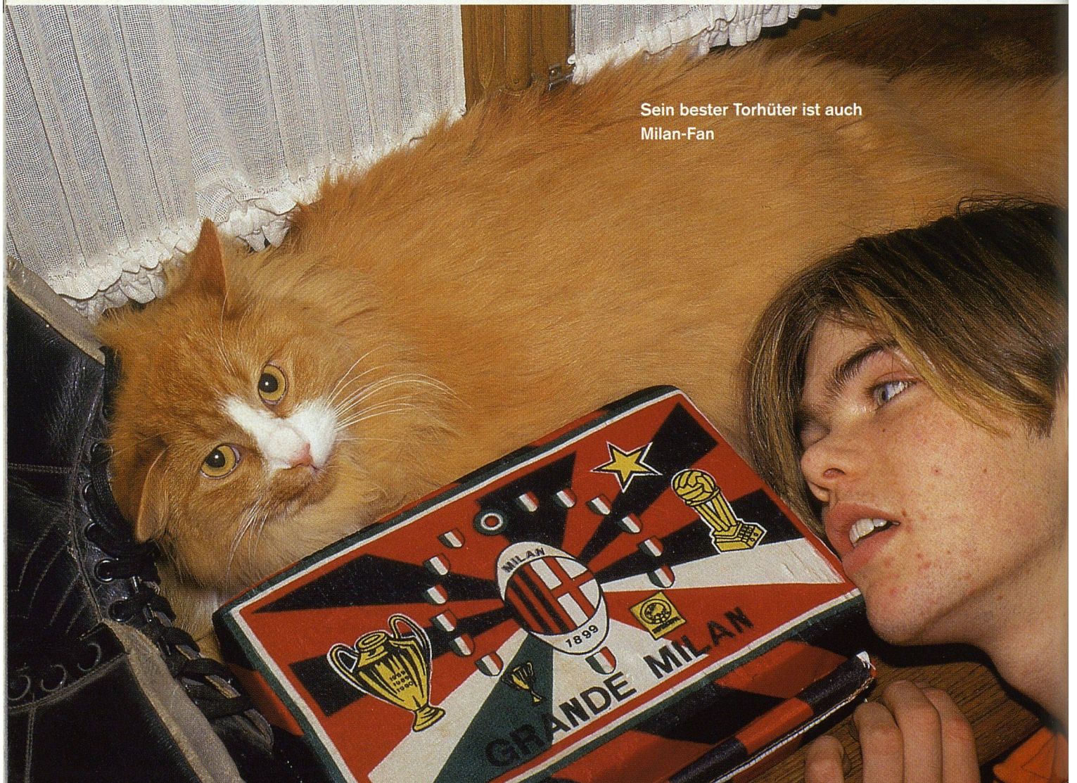
Sein bester Torhüter ist auch Milan-Fan

Mit manchen Produkten, die der Mensch für sein Tier kauft, verwöhnt er in erster Linie sich selber. Zum Beispiel mit der Hundezahnpasta. Mit dem Kochbuch für Hunde. Mit dem Shampoo für schwarzhhaarige Hunde, das die «natürliche Farbe verstärkt und seidigen Glanz gibt». Mit dem besonders milden Hundeshampoo für den täglichen Gebrauch. Mit dem «Pick-up», einer Art Etui aus grünem Kunststoff, innen ausgekleidet mit einem Robidosäckchen, mit dem sich der Hundekot garantiert hygienisch aufnehmen und entsorgen lässt. Mit den Hundemäntelchen aus Strick, gefüttertem Jeansstoff, Plastik oder abgestepptem Windjackenstoff. Mit dem Automatic Pet