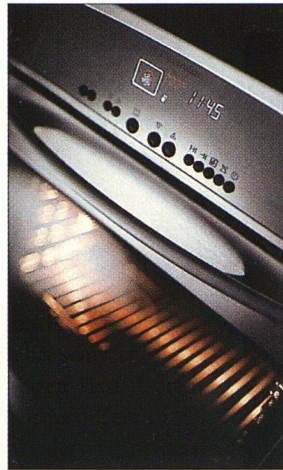
Blick in die Zukunft – Kochherd von Electrolux (Swissline 2000 EB SL 6).