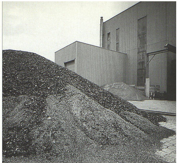
80 Prozent der Rohstoffe sind Altglas

Der Marktleader der Schweizer Dämmbranche, die ISOVER AG, setzte früh und konsequent auf Ökologie und Innovation. Der Hersteller des gelben Dämmstoffes aus 80 Prozent Altglas erwartet einen Umsatzsprung von 20 Prozent.