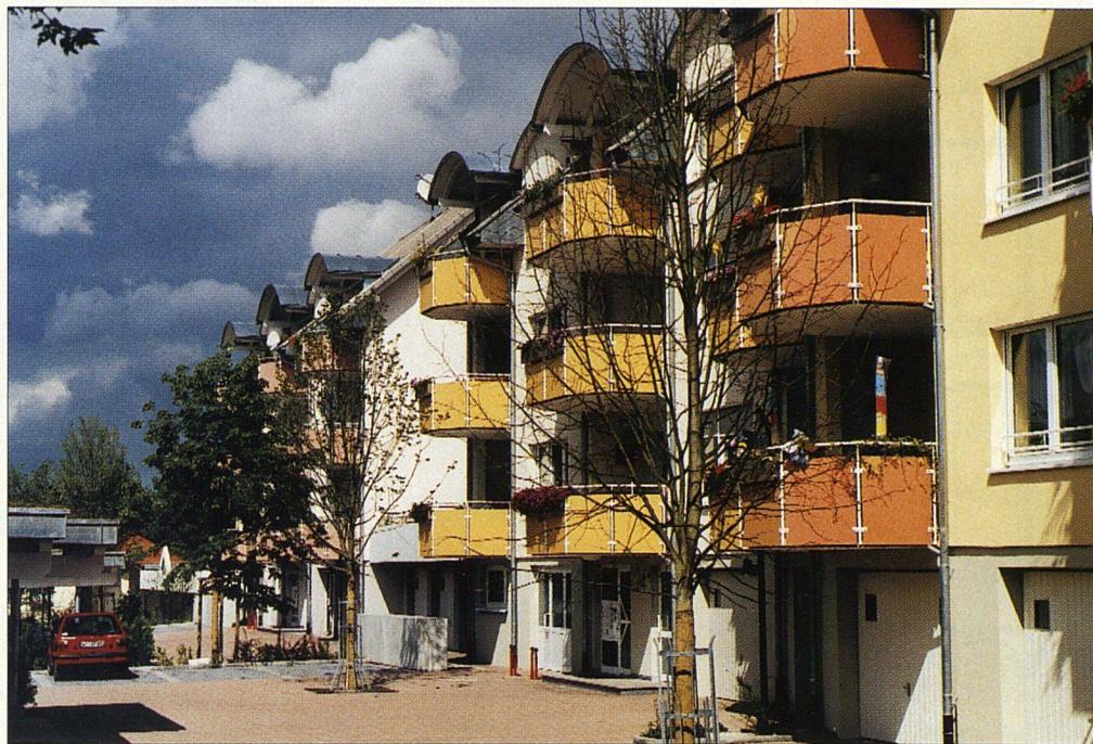
Neue Siedlung «Am Dorfbach» in Obersäckingen mit Niedrigenergiehäusern

Die Familienheim-Baugenossenschaft Bad Säckingen hat seit Anfang der achtziger Jahre das «wohnen» abonniert. Das war das einzige, was wir über sie wussten. Unseren «Gwunder» stillten wir bei einem Blick über den Rhein.