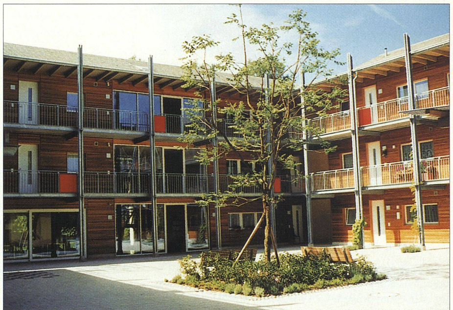
Ein Baum steht im Mittelpunkt des Eingangshofes.

renten durch und bietet einiges fürs Auge: Die dreigeschossige Anlage ist in drei unterschiedlich grosse Baukörper aufgliedert. Sie ist in U-Form gebaut und öffnet sich dem Quartier gegen Norden hin. Der zentrale Eingangshof mit dem Baum in seiner Mitte ist durch die Orientierung der Laubgänge und des Veloabstellhäuschens garantiert belebt. Der gelbe Anstrich, die schallschluckende Lärchenholzschalung und kleine, rote Elemente in den offenen Aufgängen wirken freundlich. Sehr hell durch ihre Glaswände