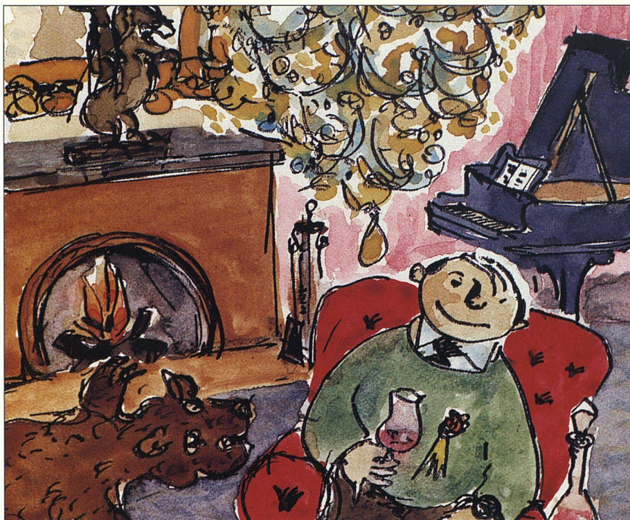
...oder Protzer – alle haben sie ihren eigenen Möblierungsstil.

Wie die VillenbesitzerInnen wohl ihre WCs dekorieren? Ich werde sie nicht fragen können – sie sind sicher wieder im Bentley an mir vorbeigerauscht... ■