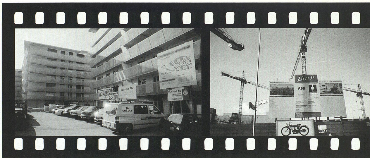
Bei der neu erstellten Überbauung Röntgenstrasse scheuten Genossenschaften das Risiko, in Zürich-Oerlikon sind meist Private am We