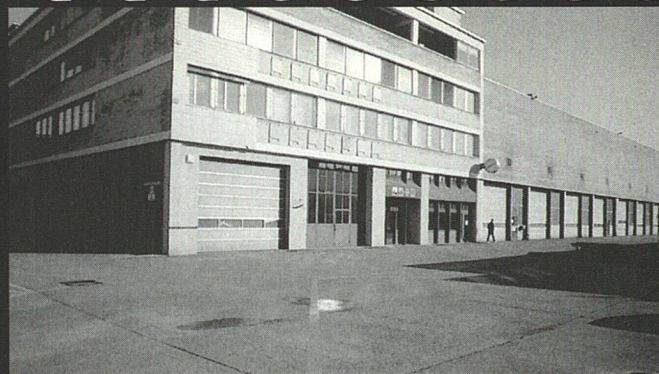
Bei der Umnutzung dieses Areals schlug die Genossenschaft KraftWerk1 zu, beim Hatt-Haller-Areal ist die Lage noch offen (rechts).