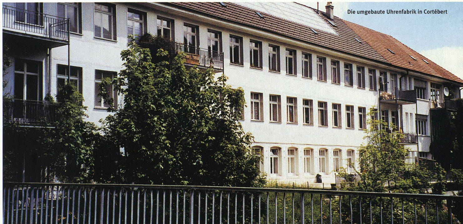
Die umgebaute Uhrenfabrik in Cortébert

hatte die Liegenschaft neu schätzen lassen und zählte die Genossenschaft nun zu den Risikopositionen. Statt vier Millionen, wie es in den Büchern stand, war die ehemalige Uhrenfabrik mit 13 Wohnungen nur noch zweieinhalb Millionen wert. Die Bank verlangte eine Reduktion der ersten Hypothek sowie einen höheren Zinssatz aufgrund des schlechten Ratings. Gleichzeitig spernte sie das Kontokorrent ihres Schuldners und verunmöglichte es