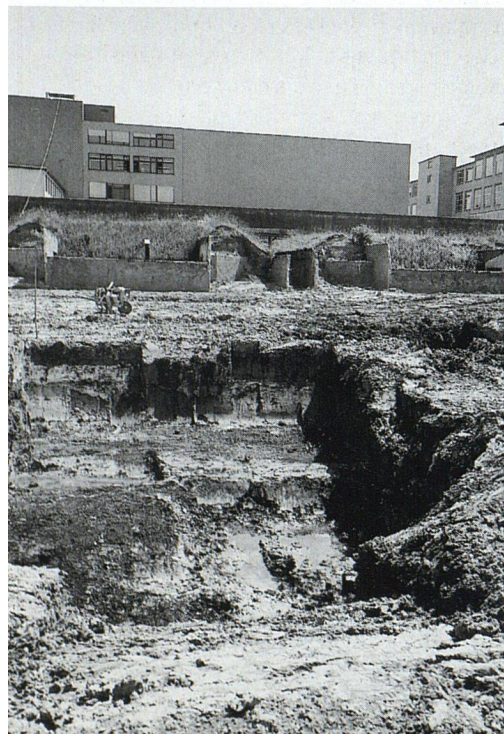
Links: Die ABZ kaufte das Land Altlasten-bereinigt: Die Beseitigung führte zu einem halben Jahr Verzögerung.

Bei Redaktionsschluss waren noch einige nicht subventionierte Wohnungen mit 4½ bis 6½ Zimmern frei. Dokumentation bestellen bei: ABZ, Postfach, 8055 Zürich Telefon 01/455 57 60 E-Mail: vermietung@abz.ch