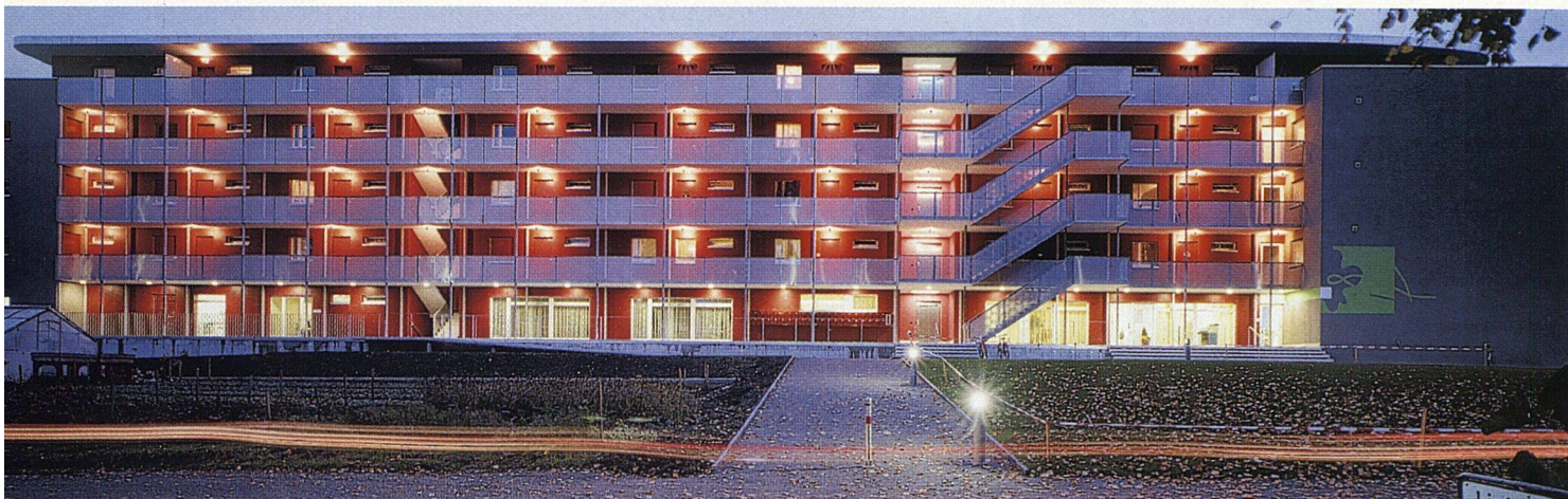
Harz, Austria