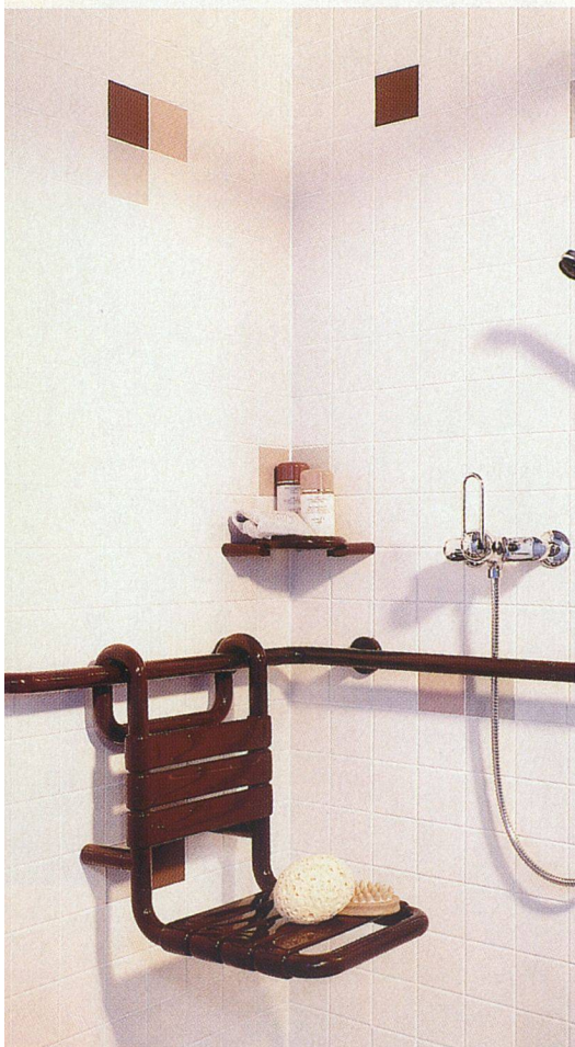
Eine Duschrückrichtung speziell geeignet für ältere oder behinderte Menschen

bei Bedarf Raum für einen Duschsitz oder eine Hilfsperson, aber auch für die Dusche zu zweit. Ausserdem sollte darauf geachtet werden, dass ein höhenverstellbarer Brausehalter montiert wird. So haben Gross und Klein Zugang zum erfrischenden Nass.