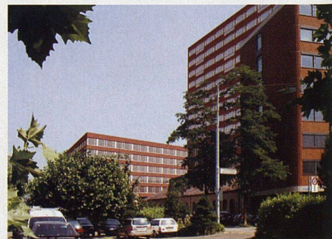
Wettbewerbsprojekt für das Luwa-Areal in Zürich-Albisrieden (2001). Um trotz sehr hoher Ausnützungsziffer in dem ehemaligen Industrieareal grosszügige Wohnungen und gute Freiflächen zu gewinnen, schlägt der Wettbewerbssieger Patrick Gmür ein Wohnhochhaus von vierzig Metern Höhe vor.