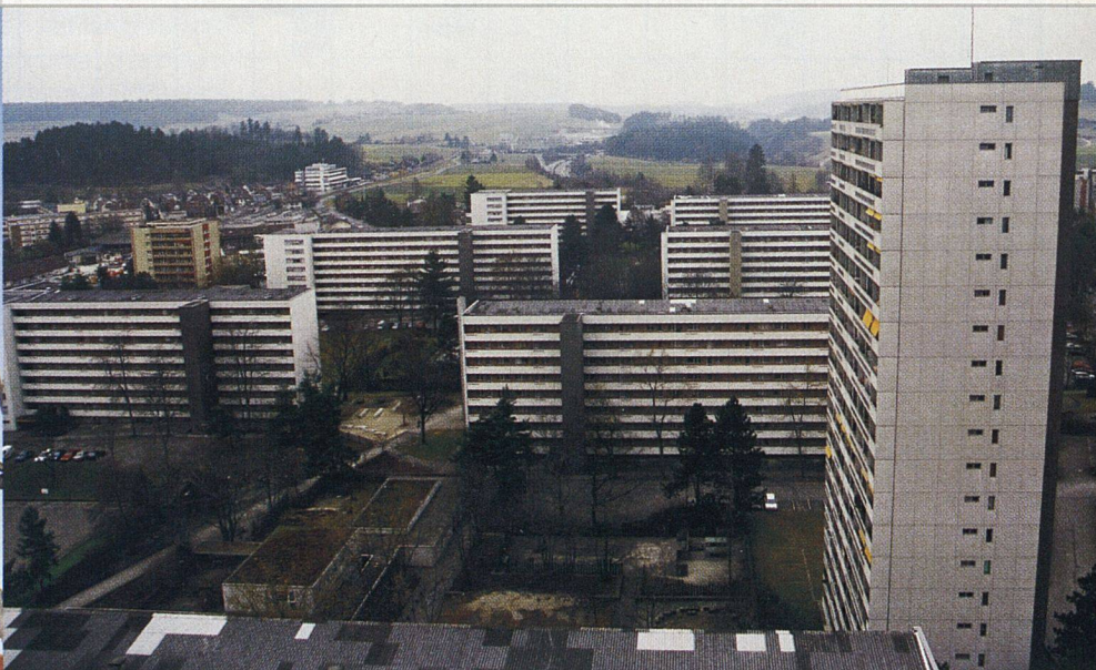
Die BewohnerInnen schätzen den grosszügigen Aussenraum ganz besonders.

Das Herz des Tscharnerguts ist der Dorfplatz mit Restaurant und verschiedenen Geschäften.