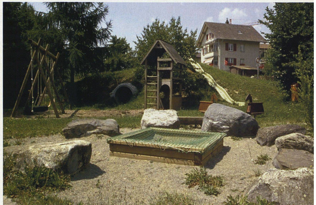
Abwechslungsreicher Spielraum für Gestaltungs-, Bewegungs- und Rollenspiele.

Von spielenden Kindern kann nicht erwartet werden, dass sie aufpassen, ob sie durch andere Kinder gefährdet sind oder diese gefährden. Spielgeräte und -bereiche müssen daher entmischt werden; z.B. darf der Auslauf der Rutschbahn nicht in den Sandkasten münden. Bei der Planung der Spielbereiche und der Wahl der Geräte sollte die Topografie des Geländes berücksichtigt und ausgenutzt werden; z.B. die Rutschbahn an einen Hang bauen.