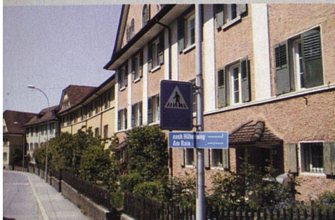
Der damalige Charakter konnte bewahrt werden.