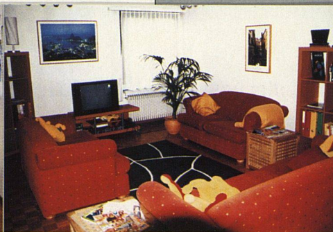
Im Wohnzimmer wird nicht weniger ferngesehen als anderswo.