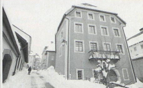
Das Haus der Genossenschaft Rocher 12 in La Chaux-de-Fonds ist nun mit Sonnenkollektoren ausgestattet.