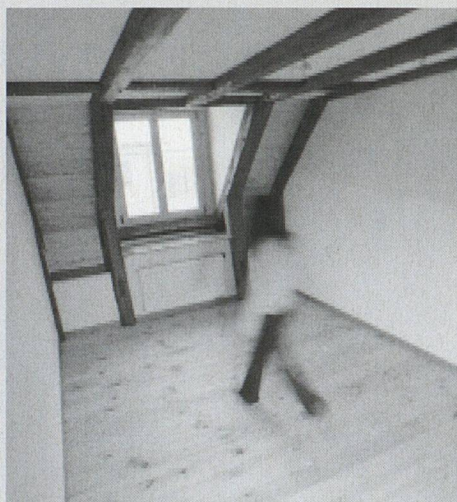
Blick in die renovierte Wohnung.

*Dieser Beitrag beruht auf einem Text von Giovanni Sammali.