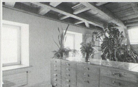
Die neue Maisonettedachwohnung wird von einer vierköpfigen Familie bewohnt.