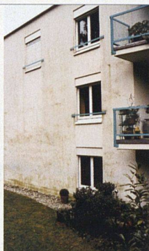
Starker Algenbefall überzieht die Nordfassade bis knapp unter das Flachdach.

PROBLEMATISCHE DÄMMUNG. Bei der Siedlung in Höngg traten auch im Sockelbereich an exponierten Stellen wie Schattenseiten, Maueranschlüssen und Lichthöfen Schäden durch Feuchtigkeit auf. Dabei hatte man die