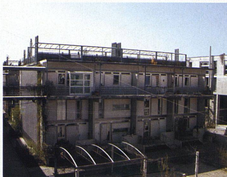
Die Fassaden auf der Schattseite bestehen aus verschiedenen kastenförmigen Holzverkleidungen und kleineren Fenstern – nicht zuletzt aus Energiespargründen.