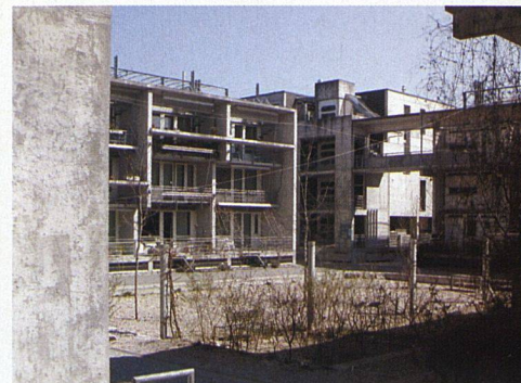
Einer der beiden Innenhöfe mit Blick auf die nordwestliche Ecke der Siedlung.

mal ein Notfall eintritt – etwa bei Trennungen –, darf die Wohnung allerhöchstens zwei Jahre vermietet werden. Und wer kontrolliert das? «Zur Durchsetzung dieses Grundsatzes besteht eine Meldepflicht gegenüber der Genossenschaft», sagt Fivian.