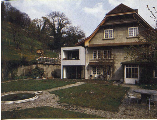
Blick vom Garten, links ist der neue Anbau ersichtlich. Er enthält Lift, Küchen und Nasszellen.