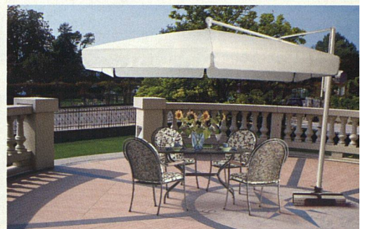
Auch Sonnenschirme gibts mit grossen Flächen; besonders formschön sind Freiarmschirme (Glatz AG, Frauenfeld).