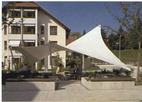
Auch die Wohnbaugenossenschaft Matt in Littau entschied sich für ein Sonnensegel (Bieri Blachen AG).