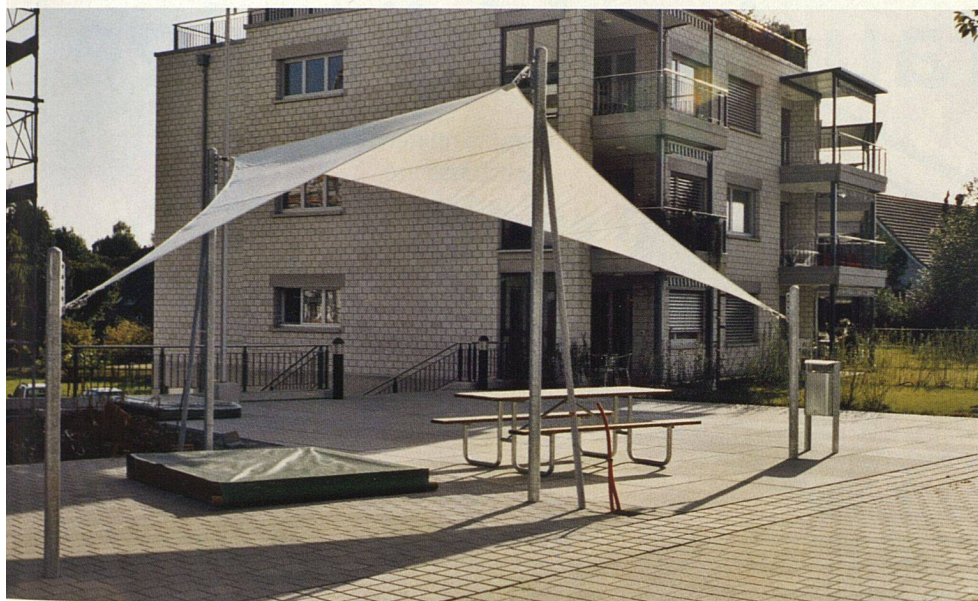
Frei stehendes Sonnensegel bei der Überbauung Spuhlacker, Tägerwil (Texblatech, Märstetten).

dass die Segel bei Sturmwinden von selbst eingerollt werden. Gleichzeitig sind die bisweilen an Drachen gemahnenden Konstruktionen architektonische Gestaltungselemente. Im besten Fall erscheinen die geometrischen Tuchflächen als spannendes zusätzliches Element der bestehenden Bauten. Dass sie farblich auf die Umgebung – etwa bestehende Storen – abgestimmt werden müssen, versteht sich von selbst. Mit dem neutralen Weiss ist man in den allermeisten Fällen gut beraten, manchenorts