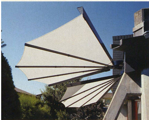
Viel Komfort bieten schwenkbare Wetterfächer (Radius Delta, Arch).