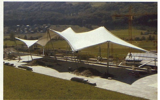
Ein Grosssegel findet sich bei der Überbauung Riedli in Belp (Bieri Blachen AG).