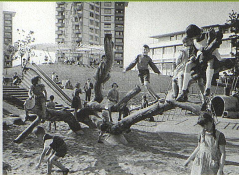
Der Spielplatz im Park Heiligfeld in den Fünfzigerjahren ...

Grün Stadt Zürich erhielt den Auftrag, ein Projekt für die Verbesserung der Parkanlage zu entwickeln, was unter Einbezug der Wohnbevölkerung geschah. An einem Gesprächsforum tauschte man Ideen aus. Zwei Themen-