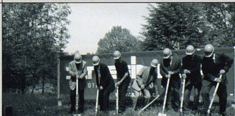
Baubeginn in Zürich-Witikon. 75 Wohnungen erstellen die Baugenossenschaften Asig und WSGZ gemeinsam.