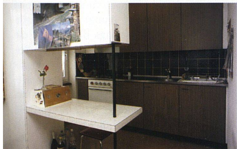
Die Küche aus den 60er-Jahren (links) mit unpraktischem Trennmöbel wurde komplett erneuert (unten).

BAD MIT VORWANDINSTALLATION. Kreativität erforderten auch die selbst bei den grösseren Wohnungen kleinflächigen Bäder, die überdies keine Fenster besitzen. Hier setzte man auf eine praktische Vorwandlösung, die alle Leitungen aufnimmt. Damit liess sich auf die alten Leitungen verzichten, die man damals einfach in die Wände eingemauert hatte – ohne Isolation und in viel zu grossen (und damit schallübertragenden) Dimensionen. Grosse Spiegelschränke, ein raumsparendes Lavabo, gänzlich mit hellen Plättli versehene