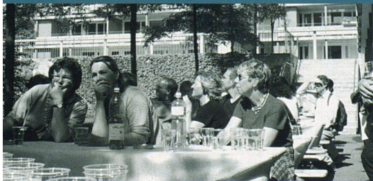
Der Neubau Rietgraben in Wallisellen war die letzte Station der diesjährigen Besichtigungstour des SVW Zürich.