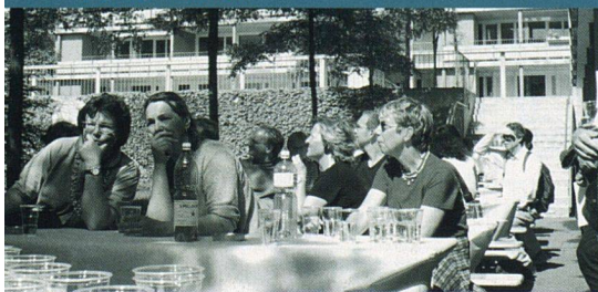
Der Neubau Rietgraben in Wallisellen war die letzte Station der diesjährigen Besichtigungstour des SVW Zürich.