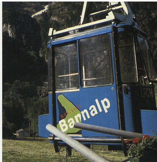
. . . um dann mit der Seilbahn in die Schule zu fahren.

«Jetzt gibt es kein Zurück mehr!», schiesst es mir durch den Kopf. Die Seilbahn beginnt in die Höhe zu fahren, die Häuser unter mir werden immer kleiner und zu allem Überfluss hängen noch riesige Holzlatten unter der Kabine. «Die sind für den Ausbau einer Alphütte», erzählt ein welscher Zivildienstler, ohne meine Höhenangst zu bemerken. Über eine hohe Felswand hinweg überwindet die Seilbahn spielend die Höhendifferenz von 678 Metern bis zur Bergstation. Erleichtert steige ich aus und habe den Eindruck, in einer Bilderbuchwelt gelandet zu sein: Ein stiller See breitet sich vor mir aus, von grünen Wiesen