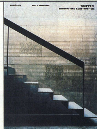
Karl J. Habermann Treppen Entwurf und Konstruktion 224 Seiten, 200 Farbabb., 128 CHF Birkhäuser – Verlag für Architektur, Basel 2003

der Basisbaustoffe Holz, Stahl und Beton. Den Hauptteil machen reich bebilderte aktuelle Beispiele aus verschiedenen Ländern aus. Nach Nutzungstypen gegliedert und umfassend dokumentiert, geben sie wertvolle Anregungen für die Praxis. Der Siedlungsbau ist zwar einmal mehr spärlich vertreten, doch sind einige der gezeigten Treppen in Bürobauten oder öffentlichen Gebäuden durchaus auch in Wohnsiedlungen denkbar.