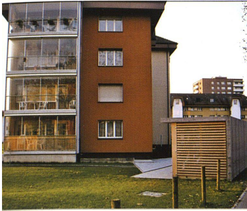
Erweiterte und verglaste Balkone erhöhen die Wohnqualität gegen den südlichen Hofraum.