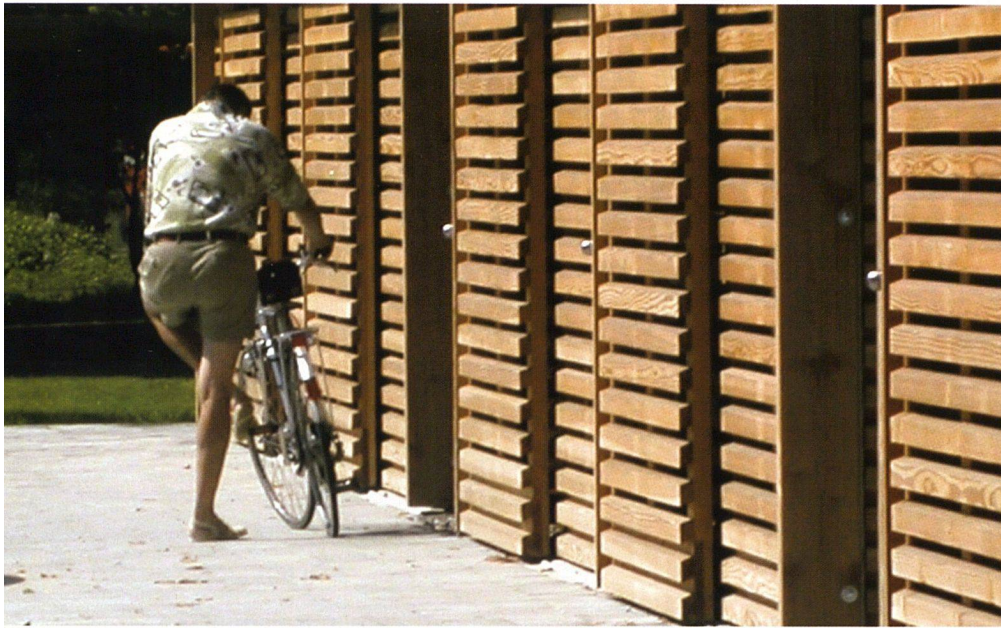
Mit seinen rostartigen Paneelen aus Fichtenholz wirkt der Unterstand im Hof wie ein Vorhang.

nierte Profil dieser Konstruktion schafft eine nun unzweideutige Grenze zwischen Strassen- und Siedlungsraum. Durchlässig ist der Unterstand dagegen vom Hof aus gesehen. Aus Fichtenholz vorfabrizierte Schiebetüren bilden die Eingangsbereiche zu den einzelnen Abstellkojen. Aneinander gereiht wirken die rostartig ausgebildeten Paneele wie ein Vorhang, der erst richtig aufmerksam macht auf das, was er