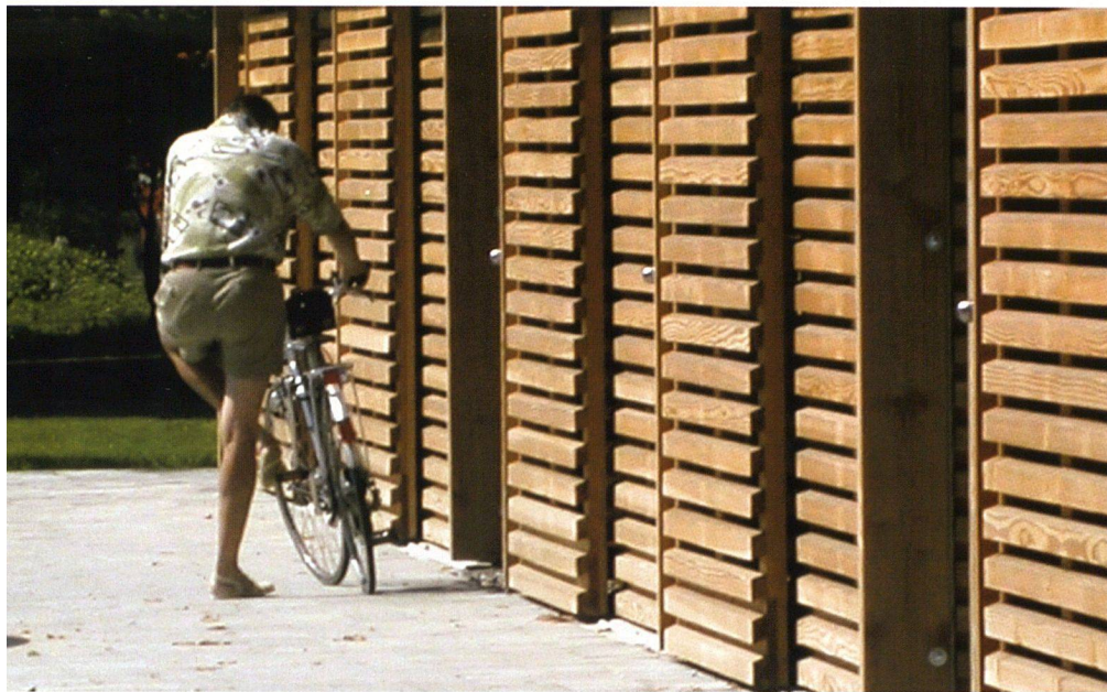
Mit seinen rostartigen Paneelen aus Fichtenholz wirkt der Unterstand im Hof wie ein Vorhang.