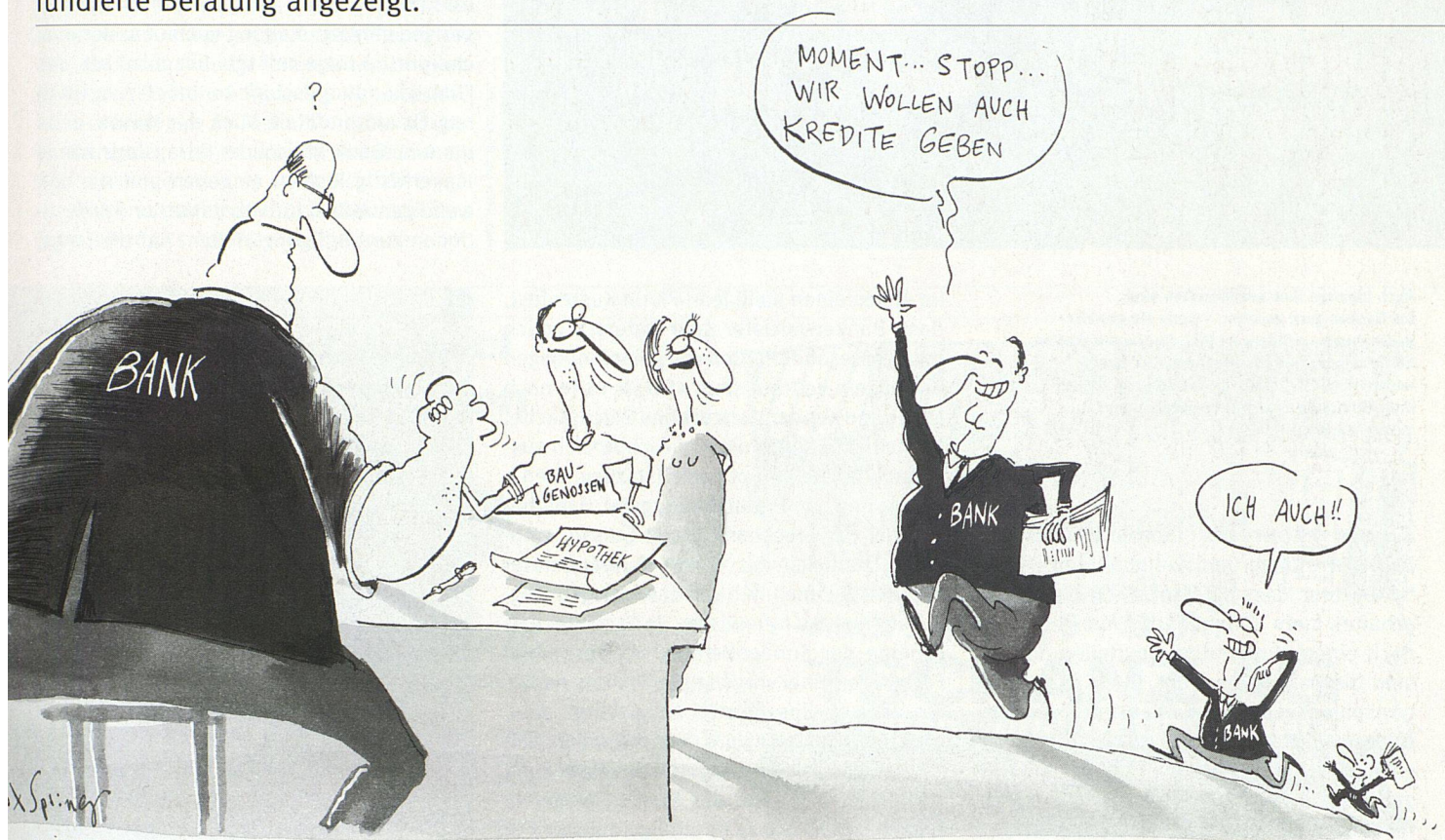
Illustration: Max Spring

Das Interesse der Banken am Hypothekengeschäft ist markant gestiegen. Vor allem für kleinere und mittlere Baugenossenschaften bedeutet dies allerdings nicht zwingend bessere Konditionen. In jedem Fall sind das Einholen von Konkurrenzofferten sowie eine fundierte Beratung angezeigt.