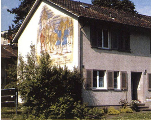
Die Reiheneinfamilienhäuschen wirken nach der Modernisierung frisch und zeitgemäss.