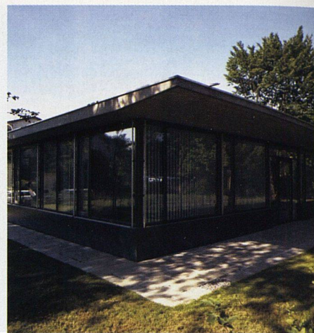
Der Pavillon mit den Büros der Baugenossenschaft Zentralstrasse.