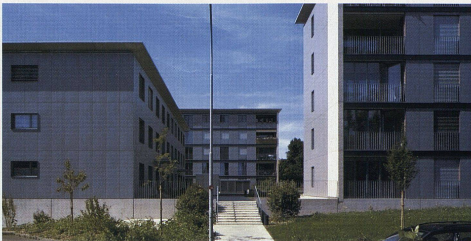
Eternitfassaden, raumhohe Fenster und verglaste Balkone prägen das Erscheinungsbild.