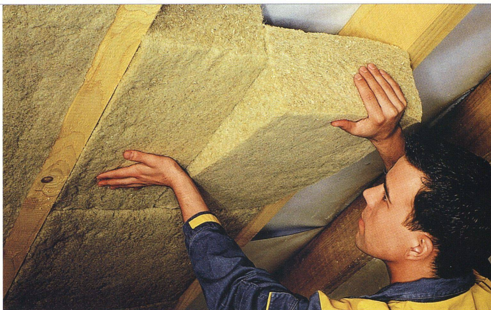
«Natureplus»-Produkte haben strenge Kriterien in Bezug auf Ökologie und Gesundheit zu erfüllen. Der Handdämmstoff Florapan von Isover, der sich durch einen besonders guten sommerlichen Wärmeschutz auszeichnet, erfüllt die Voraussetzungen.

QUAL DER WAHL. Fortschrittliche Planer und Bauträger setzen deshalb auf Produkte, die auch gesundheitlich und ökologisch von