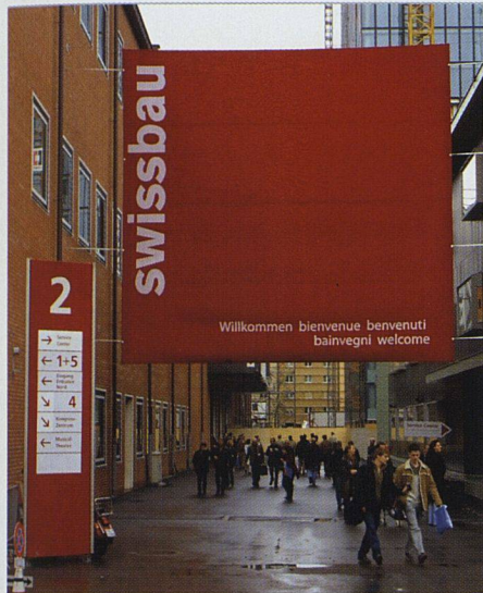
Dieses Jahr findet die Swissbau erstmals wieder als umfassende Leistungsschau statt.

Dieses Jahr besteht die Swissbau erstmals nicht mehr aus zwei thematisch getrennten, alternierenden Baumessen, sondern vereint die beiden Schwerpunkte zu einer Gesamtausstellung. Fortan will die grösste Baumesse der Schweiz Fachleuten im Zweijahresrhythmus einen umfassenden Überblick über die Branchenneuheiten geben.