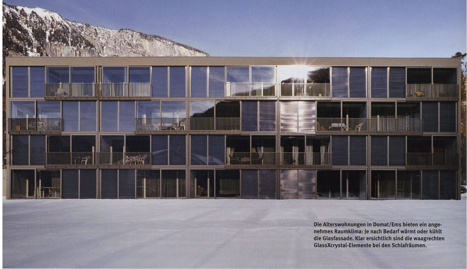
Die Alterswohnungen in Domat/Ems bieten ein angenehmes Raumklima: Je nach Bedarf wärmt oder kühlt die Glasfassade. Klar ersichtlich sind die waagrechten GlassXcrystal-Elemente bei den Schlafräumen.