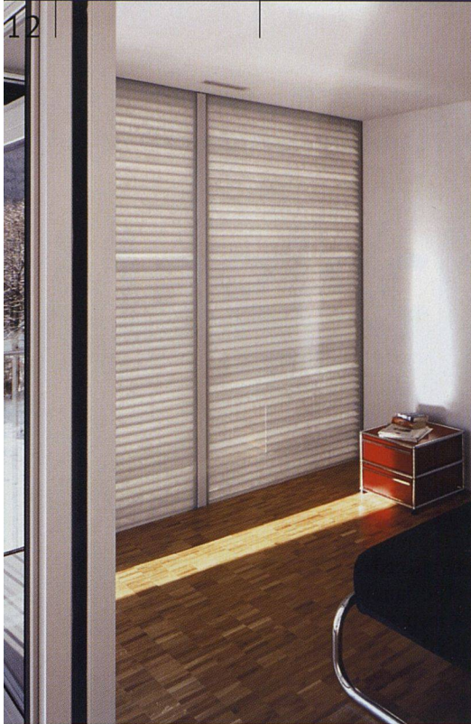
Detailansicht des GlassXcrystal-Elements. Neben seinen energetischen Funktionen sorgt es im Schlafzimmerbereich für Privatsphäre (siehe auch Titelbild).

le wurde nur eine Farbe verwendet, ein grünlich schimmerndes, zurückhaltendes Zementgrau.