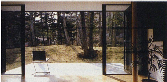
Wohnen in der Waldstadt Bremer – derzeit noch eine Utopie.