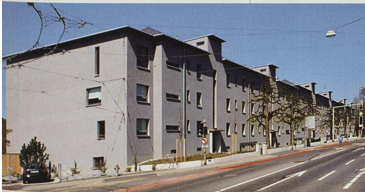
Die zusammengebauten Häuser sind auf der Strassenseite in Grau gehalten und nehmen damit sozusagen die Patina der Verkehrsimmissionen weg. Eine Lindenallee wird als Staubfilter wirken.