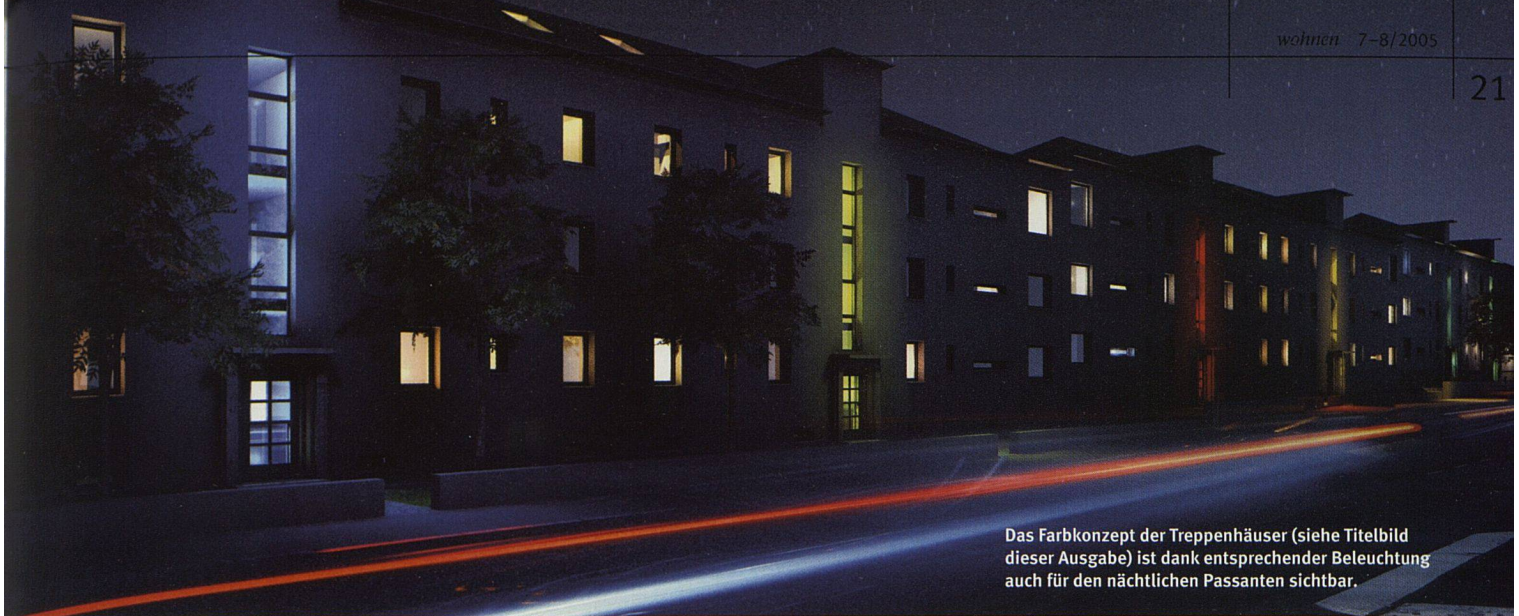
Das Farbkonzept der Treppenhäuser (siehe Titelbild dieser Ausgabe) ist dank entsprechender Beleuchtung auch für den nächtlichen Passanten sichtbar.

VON RICHARD LIECHTI ■ Versetzen wir uns ins Jahr 1938, als die Gesellschaft für Erstellung billiger Wohnhäuser im Rosenberg-Quartier am nördlichen Stadtrand von Winterthur drei Mehrfamilienhäuser baut. Man stellt sie direkt an die wenig befahrene Verbindungsstrasse nach Ohringen, reserviert auf der Hinterseite viel Freiraum, um Pflanzgärten für die in der Kriegszeit unabdingliche Selbstversorgung zu schaffen. Begehrter, dringend benötigter Wohnraum entsteht. Doch mit den Jahren wendet sich das Blatt. Die Landstrasse wird Einfallsachse und Autobahnanschluss, Verkehrsimmissionen nehmen zu. Die Grundrisse der 36 Wohnungen, die nicht einmal Balkone besitzen, vermögen den Ansprüchen nicht mehr zu genügen. Die alten Mieter ziehen weg, Wechsel häufen sich: die soziale Spirale zeigt nach unten.