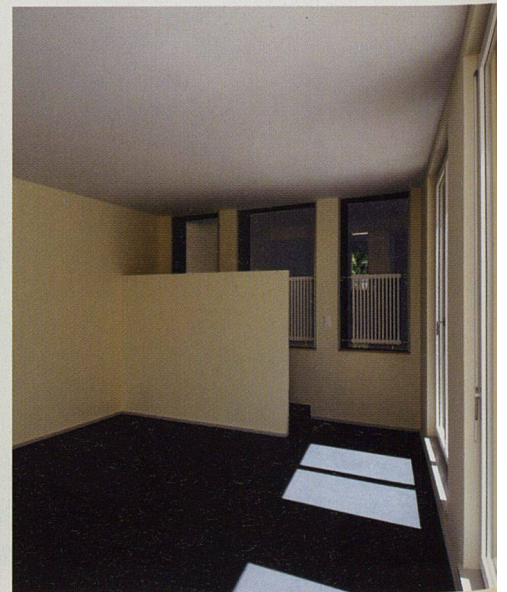
Keine der 36 Wohnungen sieht gleich aus. Das zeigt der Blick in die Wohnzimmer.