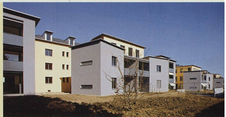
Die Vorbauten auf der Gartenseite heben sich auch farblich von den bestehenden Bauten ab.