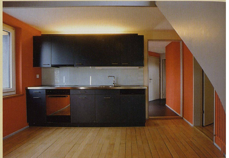
Das Zusammenspiel von Alt und Neu sowie das Farbkonzept prägen die Küchen.

war dies, weil die Architekten den Niveauunterschied zwischen den Anbauten und den auf Hochparterrehöhe liegenden Altwohnungen ausnutzten.