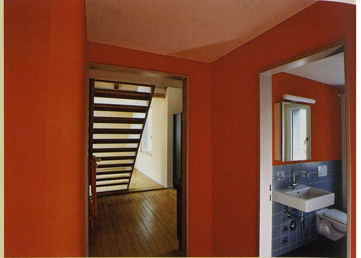
Die attraktiven Maisonette-Wohnungen bieten bis sechseinhalb Zimmer.