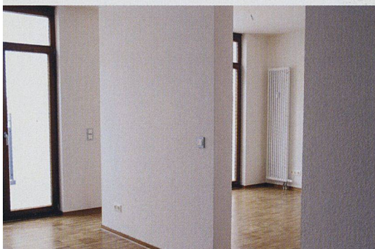
Sorgfältig ausgewählte Materialien zeichnen die 2,7 Meter hohen Räume aus.