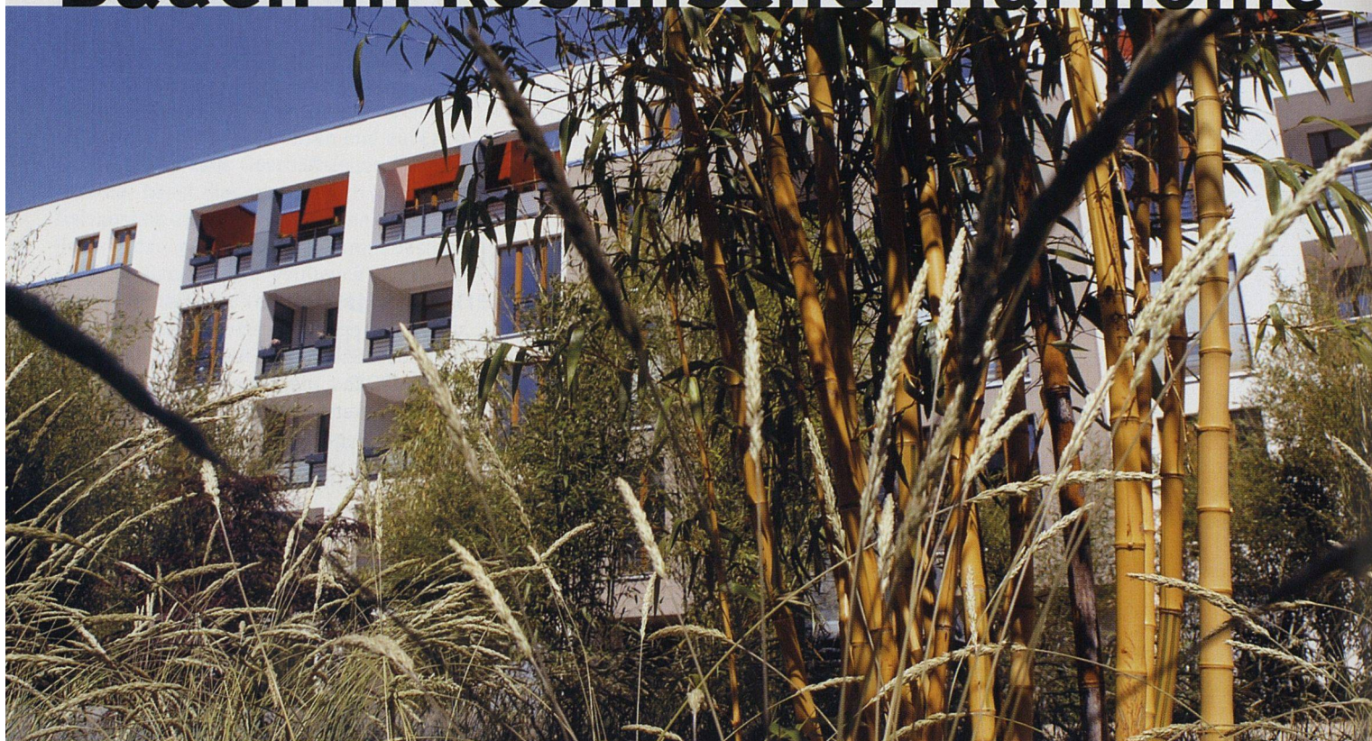
96 Wohnungen umfasst die nach Vasati-Prinzipien erstellte Siedlung der Wohnungsgenossenschaft Gartenheim in Hannover. Im Bild der Hof, dessen Bepflanzung das Fernostthema aufnimmt.

«Vasati» ist die europäische Tochter von «Vastu», einer traditionellen indischen Harmonielehre für das Bauen und eine Vorläuferin von Feng Shui. Der Wohnungsgenossenschaft Gartenheim eG in Hannover verhalf sie – neben einem geschickten wirtschaftlichen Konzept – zum Erfolg auf einem schwierigen Mietermarkt.