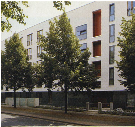
Die Architektur ist einer unpräntiösen Neo-Moderne verpflichtet – Blick von der Strassenseite.