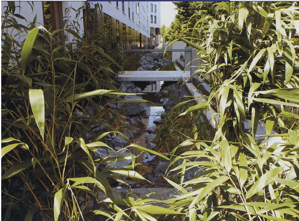
Einblick in die vielfältigen Aussenräume.

Informationsebene wie beispielsweise die Strahlungsqualität der acht Himmelsrichtungen oder die Wechselwirkungen der Planeten. Zur Erläuterung seien zwei Beispiele aufgeführt: Der Kopfbau der Anlage ist genau an der Nord-Süd-Achse ausgerichtet, obschon das allen städtebaulichen Prinzipien widerspricht und dafür der gültige Bebauungsplan für das Grundstück geändert werden musste. Diese Ausrichtung gewährleistet den ungehinderten Fluss der von Norden nach Süden strebenden Energien.