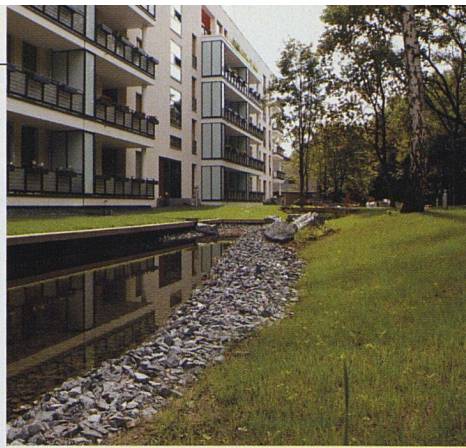
Auf der Westseite findet sich eine Freifläche mit Wasserlauf und Teehaus.