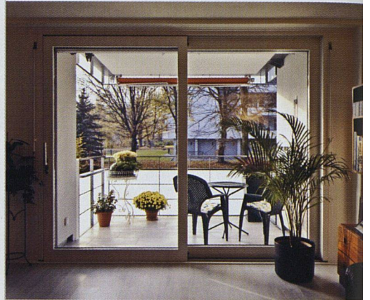
Dank den neuen Balkonen verfügen die Wohnzimmer nun über Panorama-Schiebefenster.

Keramikplatten wollte man in diesem Fall jedoch aus ästhetischen Überlegungen verzichten. Mit einer Fugenteilung hätten die markanten kubischen Bauten die flächige Erscheinung verloren.