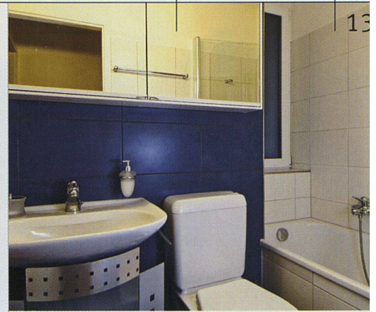
Eine neue Zweifrontenküche und ein vollständig erneuertes Bad werten die Wohnungen im Innern auf.

Preis profitierte, muss nun mit einem grösseren Aufschlag rechnen. Die Erhöhungen sind prozentual zwar beträchtlich, die – dank der Kostenmiete – bisher äusserst tiefen Mietpreise wirken sich jedoch positiv aus. So lagen die Dreieinhalbzimmerwohnungen (rund 75 m 2 Wohnfläche) zwischen 530 und 720 Franken netto; neu werden sie zwischen 1030 und 1130 Franken kosten. Die Viereinhalbzimmerwohnungen (90 m 2 ) liegen neu bei rund 1300 Franken. Für die Mieterinnen und Mieter waren diese Erhöhungen denn