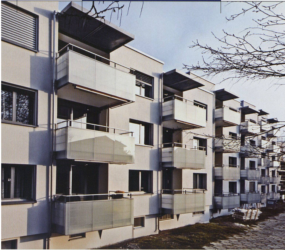
Auch die stützenlose neue Balkonkonstruktion respektiert das ursprüngliche Erscheinungsbild.