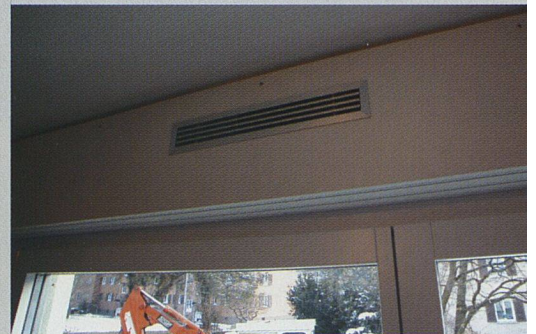
... zu den nicht mehr benötigten Rolladenkästen, wo sich das Einblaselement befindet ...