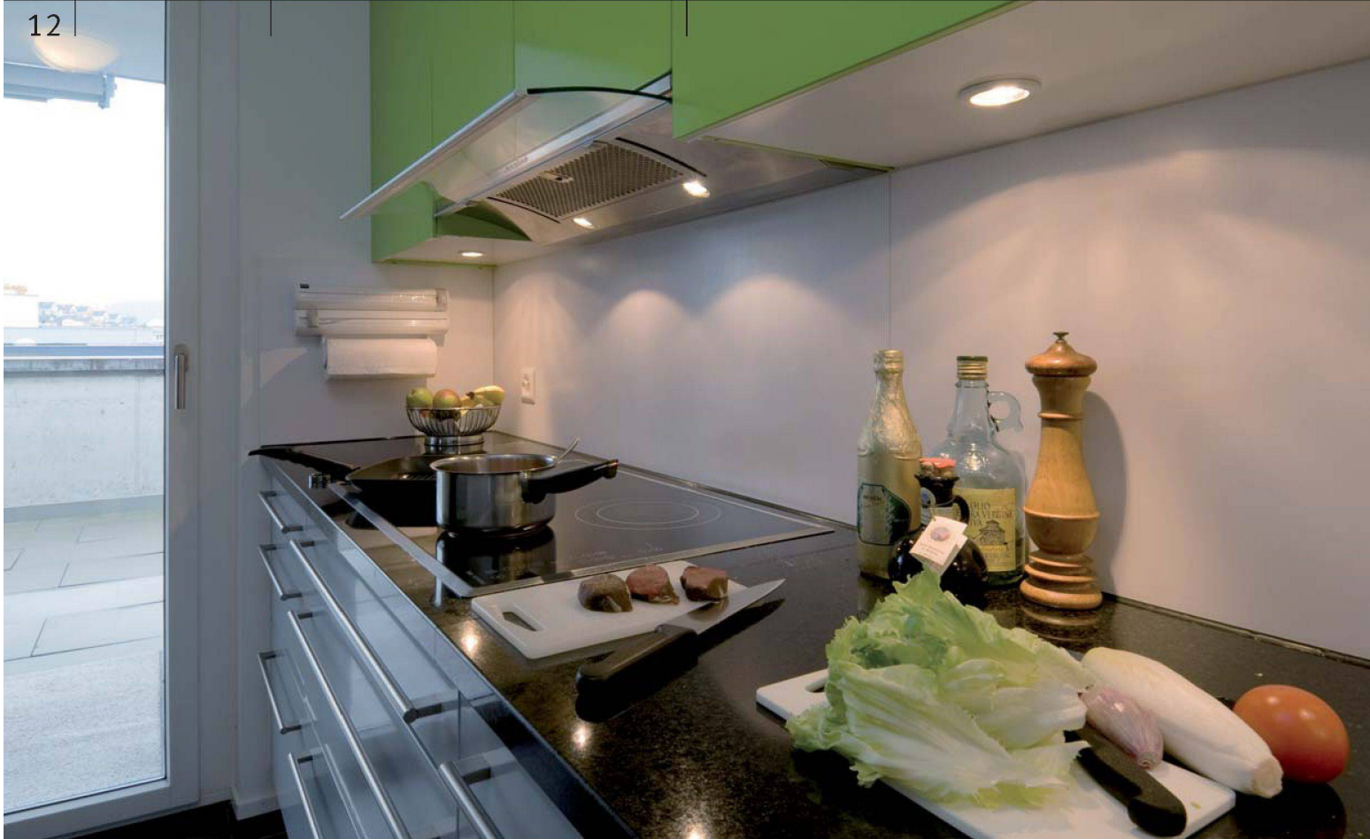
Die farbigen Oberschränke kommen dank der dunklen Granitabdeckung und den grauen Unterschränken noch besser zur Geltung.