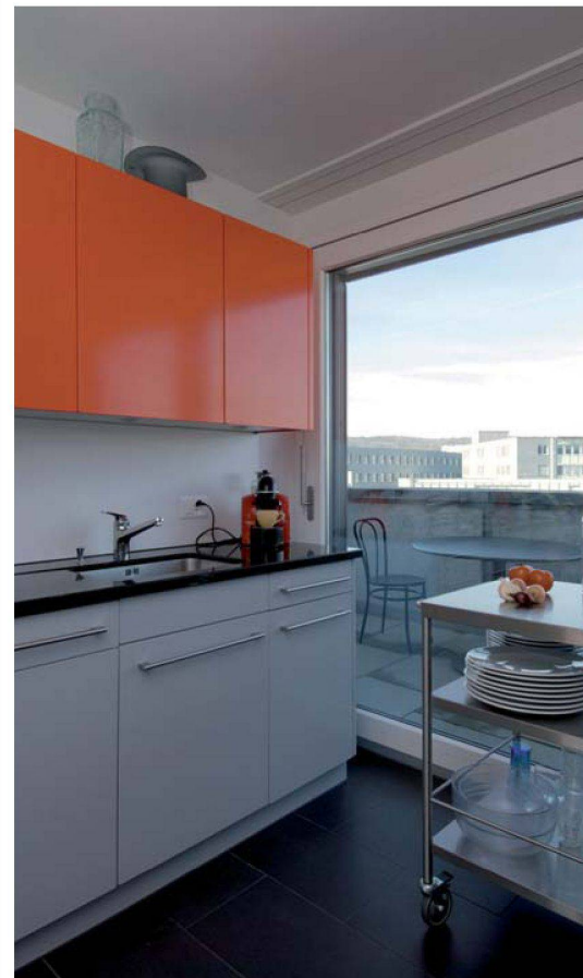
Kitchen with a view.

Bei Raphaela Sager, deren Küche in Rot daherkommt, steht das schweizerischste aller Rezepte auf dem Tagesmenü. Es gibt Fondue mit viel Knoblauch. «Die Küche ist mir wichtig, weil ich viel Zeit darin verbringe», erklärt Raphaela Sager, die mit Partner und Tochter in einer geräumigen 5½-Zimmer-Attikawohnung lebt. Sie schätzt die moderne Ausstattung der Küche, die offen gegen das Wohnzimmer und doch ein Raum für sich ist. Ein grosser, massiver Holztisch lädt direkt neben der Kochzeile zum Essen