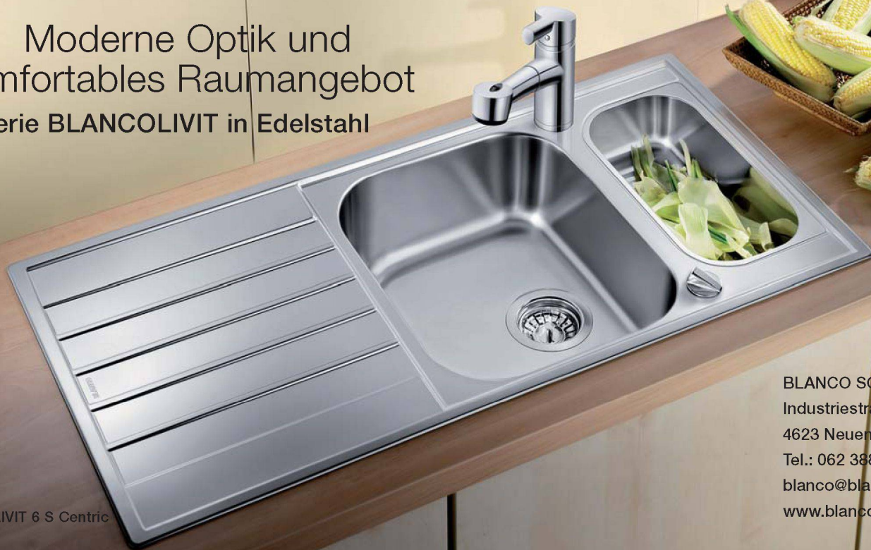
BLANCOLIVIT 6 S Centric

Moderne Optik und komfortables Raumangebot Serie BLANCOLIVIT in Edelstahl