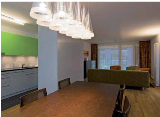
Die Küche steht wie ein Möbel im Raum: nahtloser Übergang von Kochen – Essen – Wohnen.