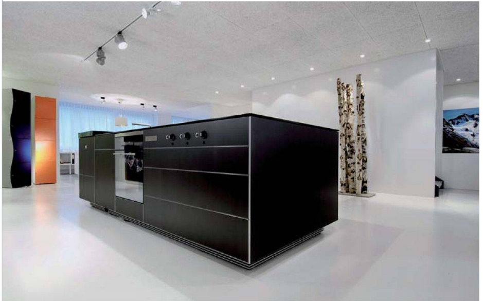
Küche der Zukunft? Die «Everest» von Wiesmann Küchen kommt als ein einziges Möbel daher.

Auch bei uns sind Küche, Wohn- und Essraum eins. Die Küche ist völlig geöffnet und die Funktionen sind umgedreht: Kochen an der Wand, Rüsten auf der Insel. Demnächst will ich mir die neueste Technik einbauen: grifflose Schubladen, die man bloss anzutippen braucht, damit sie sich öffnen und