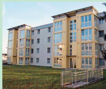
ASIG: Generelle Erhöhung um fünf Prozent auf den 1. Juli.