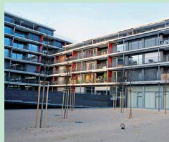
ABL: Dank günstiger Bankkonditionen vorläufig keine Erhöhungen.