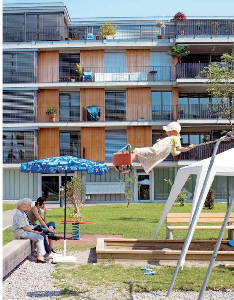
Genossenschaftlich wohnen einst und jetzt. Die Zeiten haben sich geändert, doch genossenschaftliche Werte wie Nachbarschaftlichkeit sind nach wie vor wichtig. Im Bild eine historische Aufnahme der Siedlung Burriweg (Baufreunde) sowie die 2004 erstellte Siedlung Steinacker (ASIG).

Genossenschaftlich wohnen – eine Philosophie?