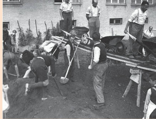
Mit anpacken war Ehrensache in der Genossenschaftsiedlung. Die Aufnahme stammt aus der «Anbauschlacht» während des Zweiten Weltkriegs.

Ich musste einiges einsacken, nicht nur von Frauen, auch von Männern. Alles, was bei mir nicht nach dem gewohnten Schema abgehalten wurde, forderte ihre Kritik heraus, die sie bei meinem Mann platzierten, und er übermittelte mir die Stimme des Volkes, was sehr lehrreich für mich war. Sachte bekam ich eine Ahnung davon, wie sehr